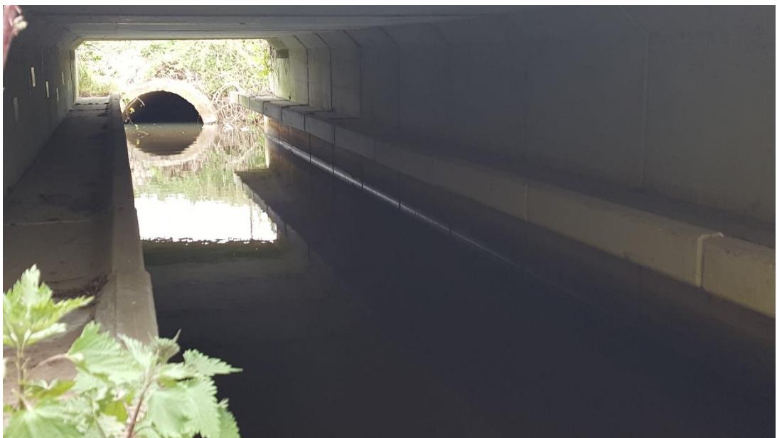
Figuur 3: Foto locatie tijdens veldbezoek op 17 april 2019.