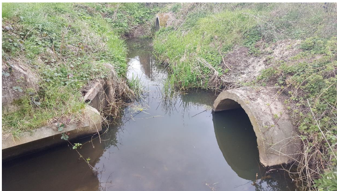
Figuur 5: Foto locatie tijdens veldbezoek op 17 april 2019 (benedenstroomse zijde).