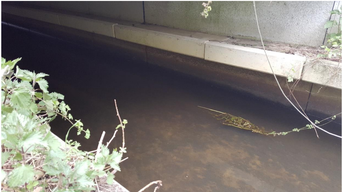
Figuur 4: Foto locatie tijdens veldbezoek op 17 april 2019.