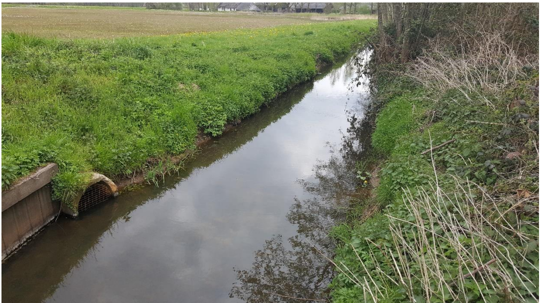
Figuur 4: Foto locatie tijdens veldbezoek op 17 april 2019 (bovenstroomse zijde).