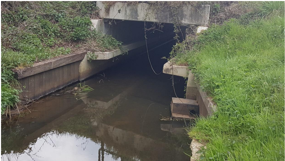
Figuur 2: Foto locatie tijdens veldbezoek op 17 april 2019 (bovenstroomse zijde).